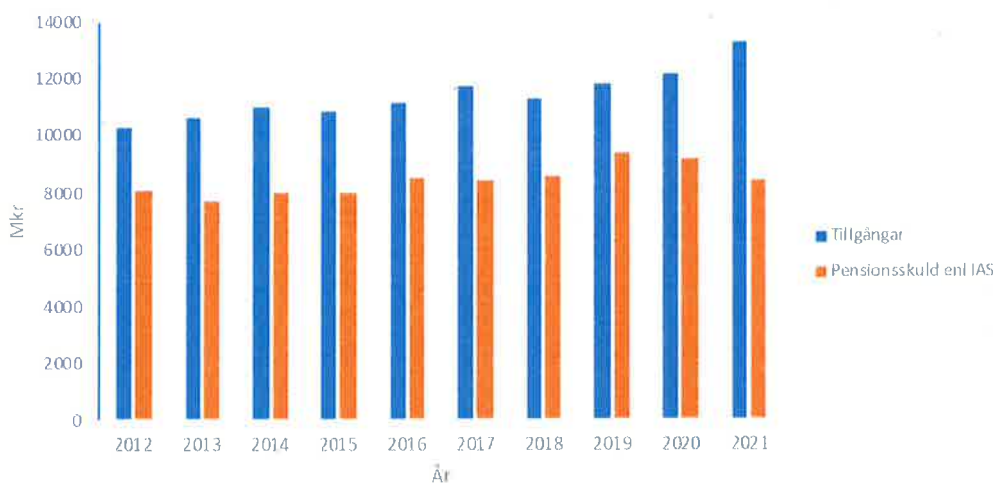
Tillgångar 1 och pensionsskuld enl IAS per 31 december 2012 - 2021

Från och med räkenskapsåret 2016 redovisas Stiftelsens värdepappersinnehav till verkligt värde.